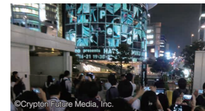
東京にある六本木ヒルズ前では、多くの人々がヴァーチャルシンガー初音ミクのARライブを楽しんだ。

バーチャルステージイベント用アプリです。期間中に所定の場所でカメラを通したAR(拡張現実)空間上で、バーチャルシンガー「初音ミク」のステージが楽しめます。