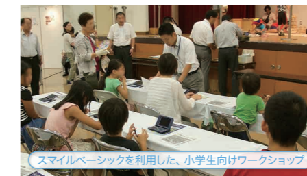
スマイルベーシックを利用した、小学生向けワークショップ

また、名古屋工学院専門学校では「Petit Developer」を授業に取り入れています。同校の先生からは、「わかりやすいツール形式のGUIや、エラー箇所を教えてくれる機能などが搭載されており、楽しみながら開発の実際を学べる」と評価されています。