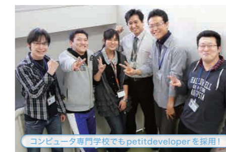
コンピュータ専門学校でもpetitdeveloperを採用!

スマイルブームが自社で開発するゲーム製作ツールは実際の教育現場でも取り入れられています。まずは、大阪府立泉尾高等学校の例。3年生の選択科目「パソコン演習」の実習教材として、2015年9月より『ブチコン3号 Smile BASIC』が導入されました。「生徒にプログラムを身近に感じてもらう、人生の可能性を広げてほしい」と、同校の先生は導入動機を語っています。