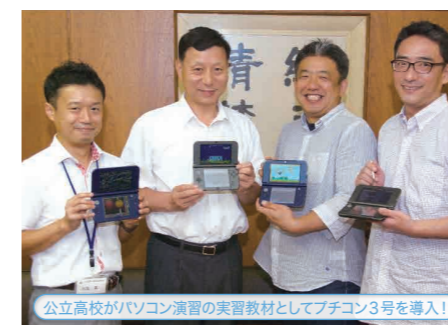
公立高校がパソコン演習の実習教材としてブチコン3号を導入!

スマイルブームが自社で開発するゲーム製作ツールは実際の教育現場でも取り入れられています。まずは、大阪府立泉尾高等学校の例。3年生の選択科目「パソコン演習」の実習教材として、2015年9月より『ブチコン3号 Smile BASIC』が導入されました。「生徒にプログラムを身近に感じてもらう、人生の可能性を広げてほしい」と、同校の先生は導入動機を語っています。